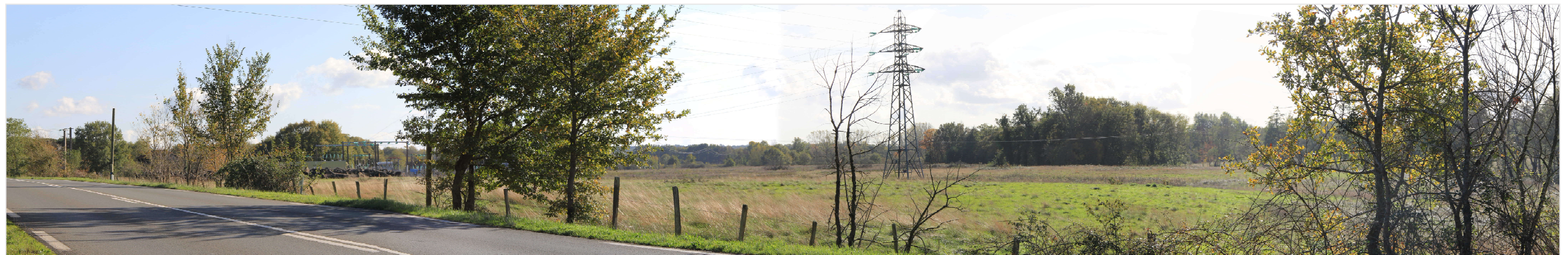
PM3 Etat actuel – Vue depuis la RD 6089 en direction de Montpon-Ménestérol

G. NOWATZKI ARCHITECTE DPLG 344 Chemin de Quarante 34370 MONTAUBAN 06.26.01.07.05 Siret 4007532730020