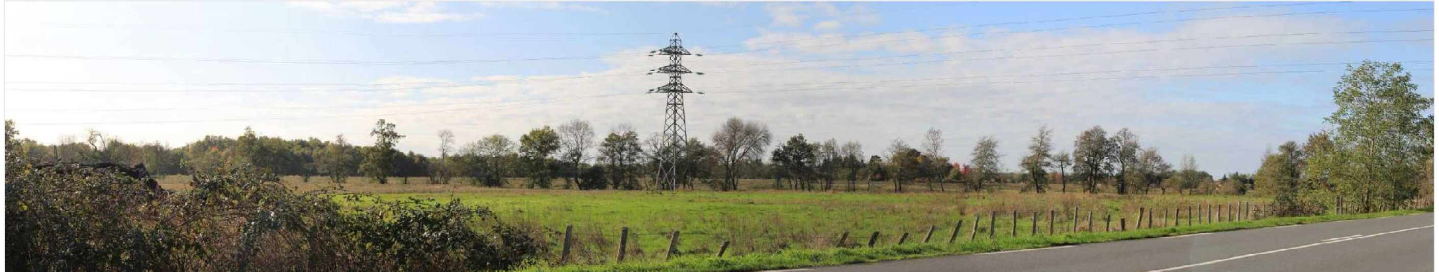
PM2 Etat actuel – Vue depuis la RD 6089, à proximité immédiate du poste électrique de transformation