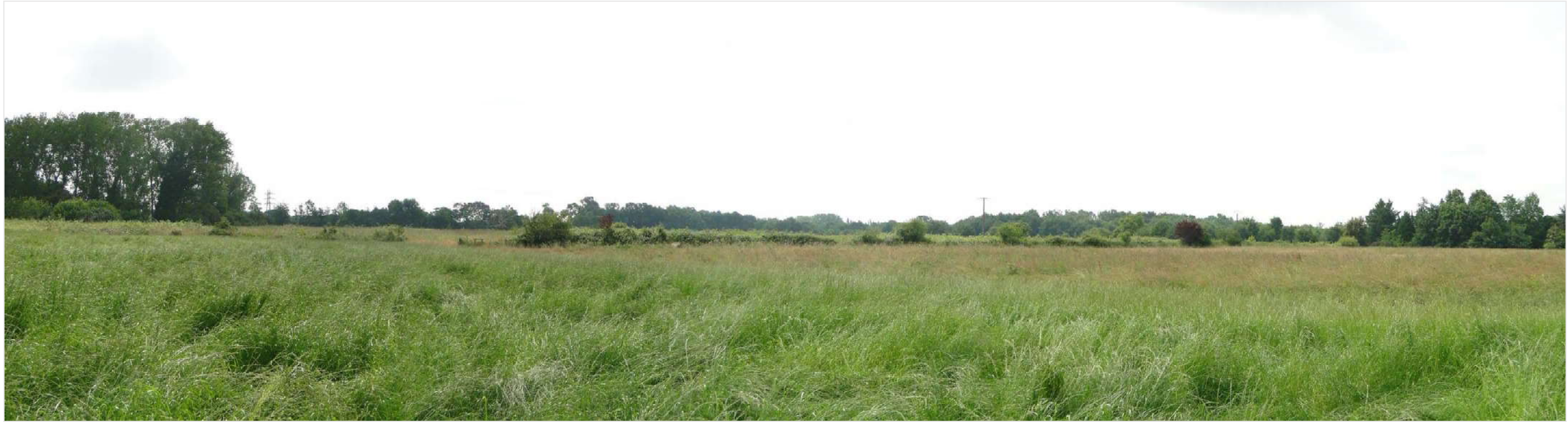
PM4 Etat actuel – Vue depuis les habitations situées à l'ouest du projet

G. NOWATZKI - ARCHITECTE DPLG 594 Chemin de Quarante 34370 MUREILHAN 06 21 11 07 05 Siret 40075027300009