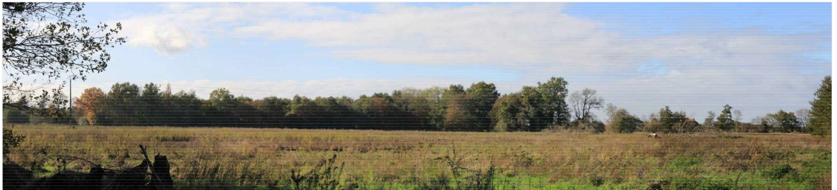
PM1 Etat actuel – Vue depuis le chemin privé menant à une habitation

G. NOWATSKI ARCHITECTE DPLG 594 Chemin de Quarante 34570 MURIGNAN 06.28.81.07.8 Siret 4007532730020